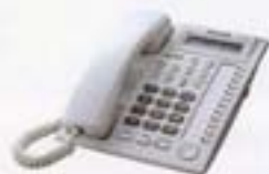
KX-T7730* 顯示型、免持聽筒對講話機